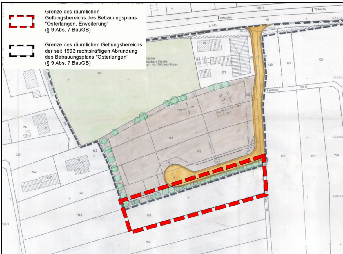
Abbildung 1: Darstellung der Erweiterungsfläche (rot markiert = aktuelles Plangebiet) im rechtskräftigen B-Plan „Osterlangen“ von 1993

Nähere Ausführungen zum seit 1993 rechtskräftigen Bebauungsplan „Osterlangen“ und zum geplanten Vorhaben sind der nachfolgenden Abbildung zu entnehmen.