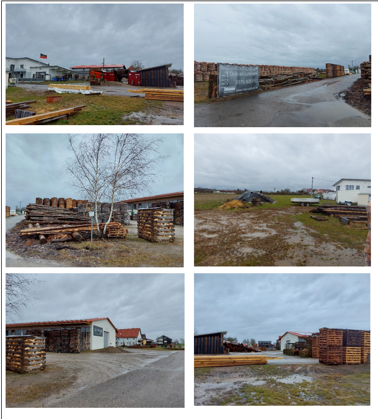
Abbildung 2: Bestandsaufnahme

Nachfolgende Fotos geben einen Eindruck des Plangebiets wieder.