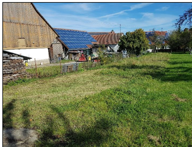
Foto 2: Blick auf die ruderalisierte Mähwiese auf dem Flurstück 5288 ausgehend vom Heerweg