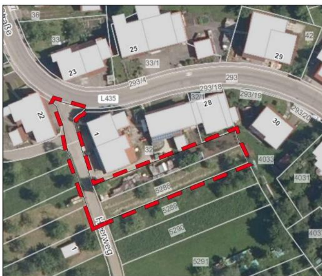
Abbildung 1: Lage des Bauungsplangebietes innerhalb der Ortslage Leidringen

Legende: rot-umrandete Fläche = Plangebiet, unmaßstäblich