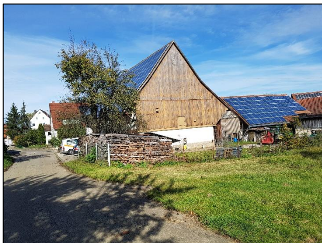
Foto 1: Blick auf die bestehende Wohnbebauung nördlich des Planungsgebietes sowie die bestehenden Lagerflächen der Hofstelle ausgehend vom Heerweg