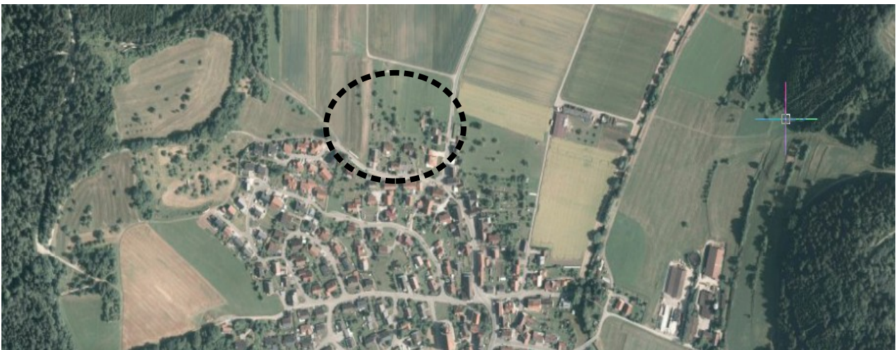
Abb. II-1: Übersichtskarte zur Lage des Plangebiets (schwarz gestrichelte Linie)

Das Plangebiet befindet sich am nördlichen Siedlungsrand vom Rosenfelder Stadtteil Heiligenzimmern. Im Süden grenzt bestehende Bebauung an. Nach Westen und Norden öffnet es sich in die freie Landschaft. Östlich wird das Gebiet von der L 390 begrenzt. (s. Abb. II-1).