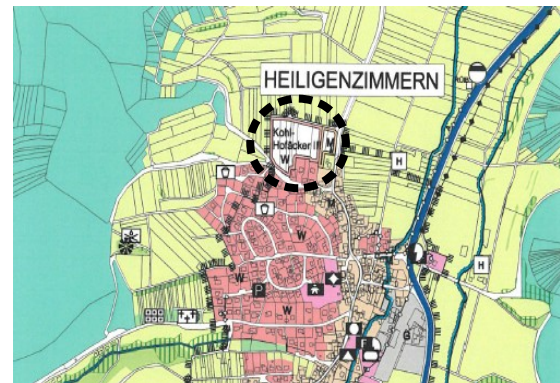
Abb. III-2: Ausschnitt FNP

Im Regionalplan Neckar-Alb (s. Abb. III-1) ist die Fläche als geplante Siedlungsfläche Wohnen und Mischgebiet ausgewiesen.