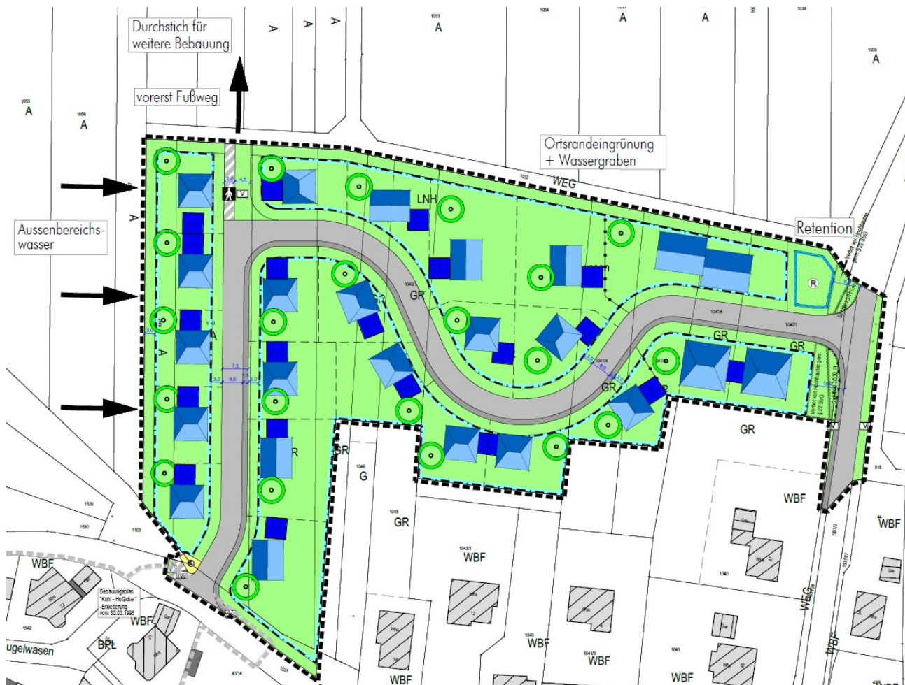
Abb. V-1: Städtebauliche Konzeption

Mit dieser baulichen Konzeption soll neue Wohnfläche geschaffen werden. Im östlichen Teil des Plangebiets ist auch eine verdichtete Bauweise angestrebt, um der stetig steigenden Nachfrage an kleineren Wohnungen für Singles, junge Paare, Senioren und andere Einzel- oder 2-Personenhaushalte gerecht zu werden. Die geplante Fußwegeverbindung inklusive Grünfläche kann bei einer möglichen folgenden Erweiterung Richtung Norden als Anschluss für eine Erschließung genutzt werden. Über einen Wassergraben und eine Retentionsfläche kann das anfallende Oberflächenwasser gesammelt und verzögert abgeführt werden.