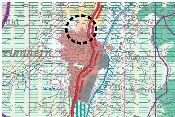
Abb. III-1: Ausschnitt Regionalplan