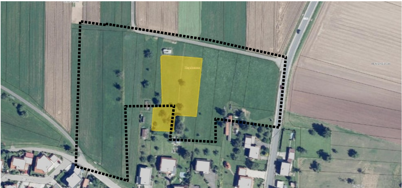
Abb. III-3: LUBW Schutzgebiete Stand 01.10.2019

Gemäß § 13a Abs. 2 Satz 2 kann ein Bebauungsplan, der von Darstellungen des Flächennutzungsplans abweicht, auch aufgestellt werden, bevor der Flächennutzungsplan geändert oder ergänzt ist; die geordnete städtebauliche Entwicklung des Gemeindegebiets darf nicht beeinträchtigt werden; der Flächennutzungsplan ist im Wege der Berichtigung anzupassen.